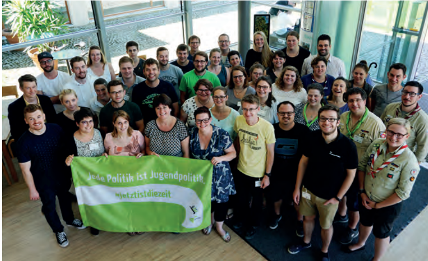
Teilnehmer*innen der BDKJ-Landesversammlung im Kloster Roggenburg