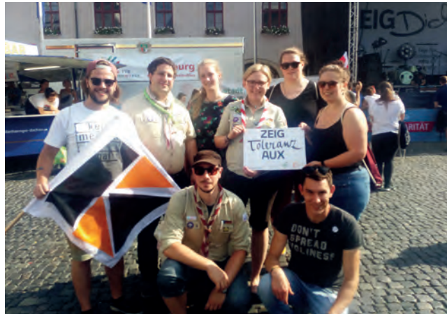
Vertreter*innen von Jugendverbänden bei der Veranstaltung „Zeig dich Aux“

Als Anfang 2018 bekannt wurde, dass der AfD Parteitag in Augsburg stattfinden wird, war klar, dass der BDKJ Augsburg