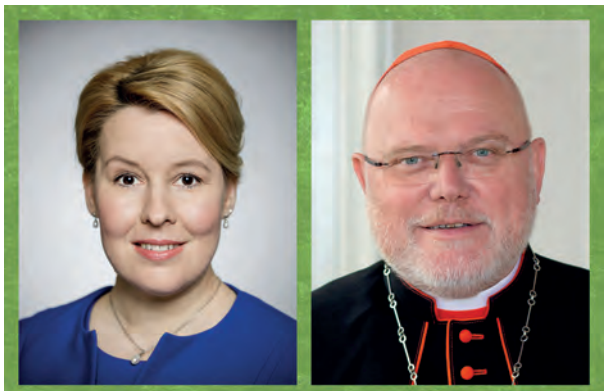
Bundesministerin Dr. Franziska Giffey und Reinhard Kardinal Marx übernehmen die Schirmherrschaft für die 72-Stunden-Aktion im Mai 2019

➔ Die 72-Stunden-Aktion des BDKJ und seiner Jugendverbände erhält prominente Unterstützung: Reinhard Kardinal Marx und die Bundesministerin für Familie, Senioren, Frauen und Jugend, Dr. Franziska Giffey, haben die Schirmherrschaft für die deutschlandweite Sozialaktion übernommen, die vom 23. bis 26. Mai 2019 stattfindet.