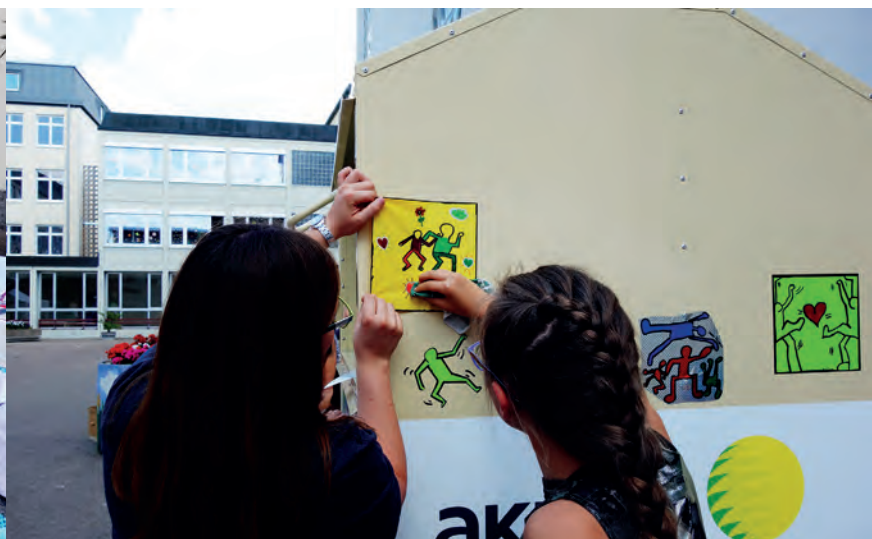
Über 400 aussortierte T-Shirts der Teilnehmer*innen wurden zur Weiterverwendung an die Aktion Hoffnung gespendet