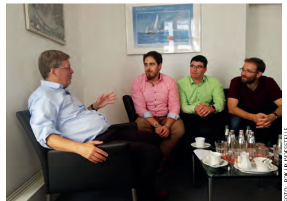
Der BDKJ-Bundesvorstand und die „aktion kaserne“ im Gespräch mit dem Wehrbeauftragten Dr. Hans-Peter Bartels.

„Den Eingriff in die Freiheitsrechte junger Menschen und ihrer individuellen Lebensplanung sehen wir auch bei einem verpflichtenden Gesellschafts-